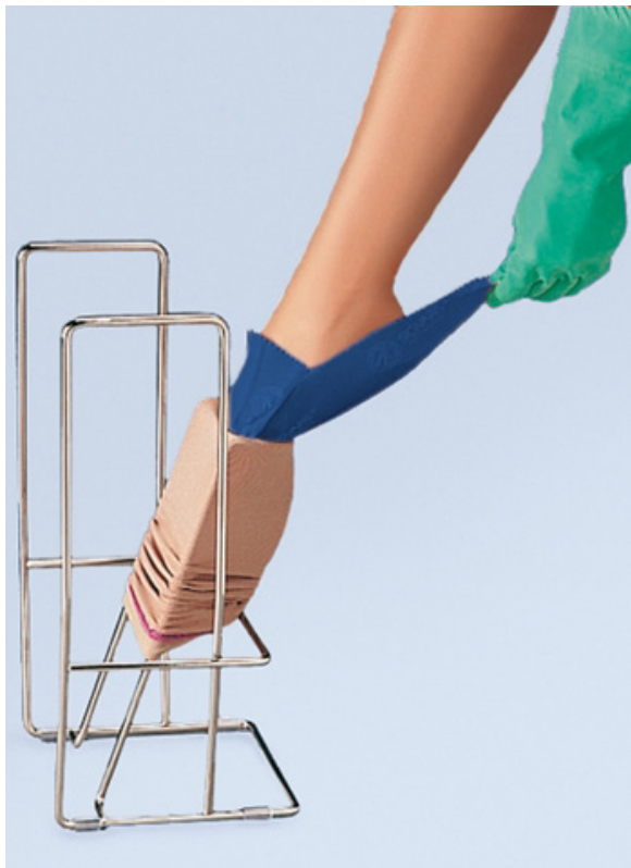
Metalstativ til påtagning af kompressionsstrømper med eller uden tå

Metalstativet er velegnet til mennesker, der har svært ved selv at nå ned til tæerne.