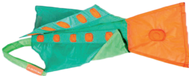
Strømpepåtager til strømper med lukket tå

Magnide er let at anvende for brugere af kompressionsstrømper og -strømpebukser med lukket tå. Desuden er Magnide et uundværligt hjælpemiddel for plejepersonalet, som har opgaven dagligt at påføre kompressionsstrømper eller- strømpebukser på deres borgere.