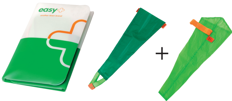
1 stk. EasySlide og 1 stk. EasyOff

Praktisk sampak til både på- og aftagning af kompressionsstrømper med åben tå.