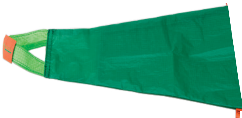
Strømpepåtager til kompressionsstrømper med åben tå

Fås også til kompressionsstrømper til arm.