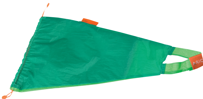
Strømpe på- og aftager i én

Sim-Slide er specielt designet til at lette på- og aftagning af kompressionsstrømper og -strømpebukser med åben tå. Det glatte materiale nedsætter friktionen væsentligt. Ved sårbehandling kan man hurtigere overgå til kompressionsstrømper, da strømpen let kan trækkes over en sårbandage ved hjælp af Sim-Slide.