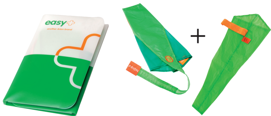
1 stk. Magnide og 1 stk. Easy Off

Praktisk sampak til både på- og aftagning af kompressionsstrømper med lukket tå.