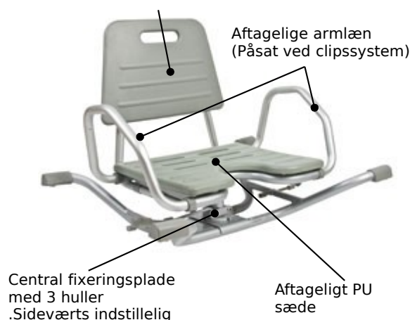
Badesæde 302022 (helhed - forfra)

Aftageligt ryglæn i blødt PU materiale (Påsat ved clipssystem)