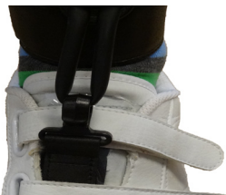
fig. 4 Dictus båndet "monteret" i monokrog

Monokrogen er en alternativ medfølgende del, der kan bruges til sko uden snørehuller eller for små snørehuller. Monokrogen skal lægges imellem velcrolukningerne på skoen eller hvis snørebåndshullerne ikke er store nok til metalkroge, så kan monokroge lægges mellem skoflap og snørebånd for at løfte forfoden.