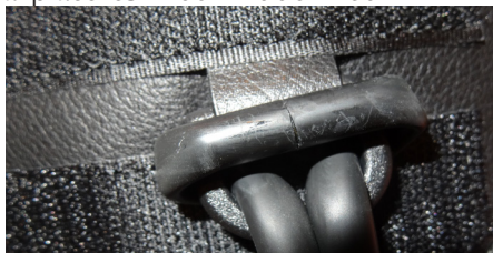
fig. 3 Gummibåndet "monteret" i D-ringen

Gummibåndet føres, med den bløde del først, op i gennem D-ringen og bindes. Gummibåndets splejsning (føles hård), skal placeres midt i knuden ved D-ringen (Se figur 3). En anden placering kan medføre at gummibåndet brister selv ved normalt brug. Gummi-båndets løftekraft bestemmes af afstanden mellem D-ringen og fastgørelseskroge. Jo større afstand, jo mere løftekraft.