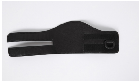
fig. 2 Dictus båndet "udfoldet med buen øverst

Læderbåndet sættes rundt om anklen med "buen" vendt opad mod læggen. Læderbåndet skal altid være uden på strømpen, ikke direkte mod huden. Når båndet sidder korrekt strammes læderbåndet med velcro'en.