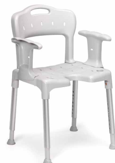
Med ryg og armlæn