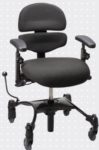
VELA Tango 500