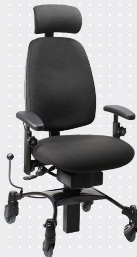
VELA Tango 510EL