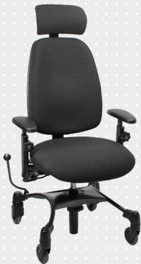
VELA Tango 510