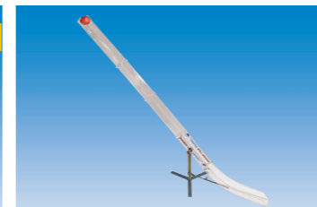
SuperRamp including backpack, 5 parts modulated. EXP1128