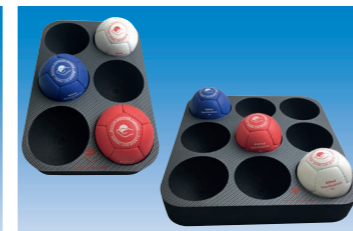
Boccia tray. EXP1101 – 6 balls EXP1102 – 9 balls