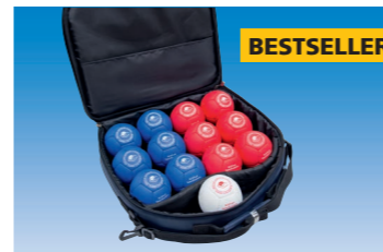
Superior Classic Boccia set in blue shoulder bag. EXP1000