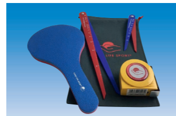
Complete referee kit. All packed in a bag. EXP1117