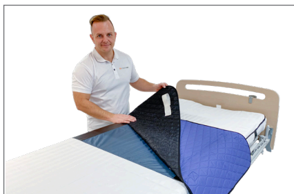
2. Placer Master Turner – S med nylonsiden nedad og den lille side opad.