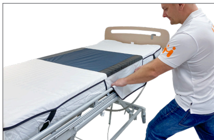
1. Monter Madrascover – S på sengens madras.