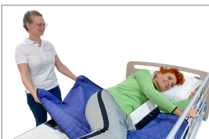
8. Vending med hjælper: Bruger griber fat i sengehesten og påbegynder vendingen. Hjælperen trækker let i Master Turner – S og understøtte vendingen til sideleje. Puder og kiler kan benyttes for en optimal støtte, tryghed og komfort.