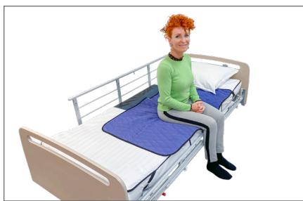
4. Placer Master Turner – S på tværs af sengen, så håndtagene i siderne vender mod hoved- og fodenden. Bruger sætter sig på sengekanten midt på Turner med numsen godt inde i sengen.