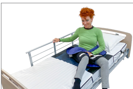
5. Master Turner kan foldes omkring brugerens bækken. Med hånden på sengehesten drejer brugeren sig ind i sengen og løfter selv benene ind i sengen.