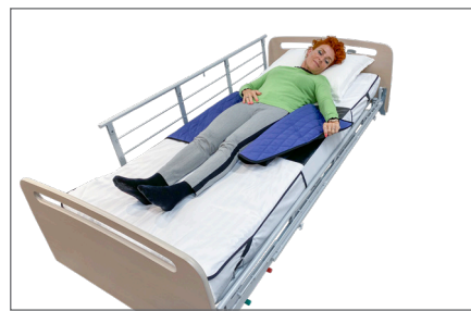
6. Fold Master Turner ud, hvis brugeren har haft den omkring sig.