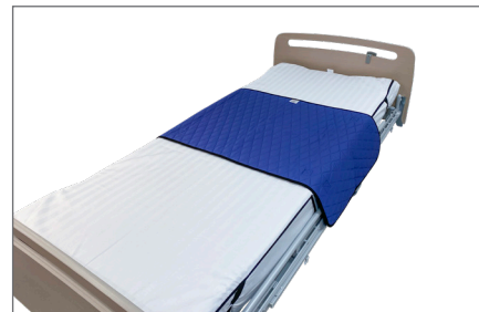
3. Master Turner er nu klar til brug.