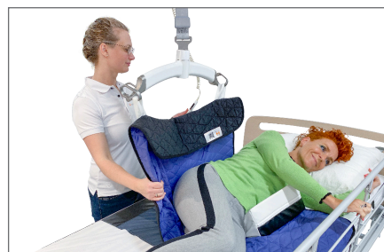
9. Vending med loftlift: Loftliften monteres i grebene. Bruger hjælper til efter formåen. Loftliften eleveres og understøtter vendingen til sideleje. Puder og kiler kan benyttes for en optimal støtte, tryghed og komfort.