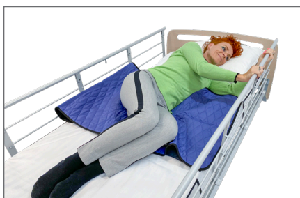
7. Selvstændig vending: Bruger kan gribe i sengehesten og vender sig til sideleje. Glidet under bækket nedsætter friktionen og gør det lettere at vende sig. Lejringskile – S anbefales for optimal støtte, tryghed og komfort.