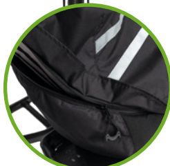
2-vejs lynlås med hænger.