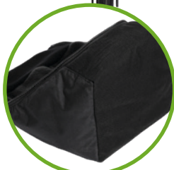
Isoleret bundplade i meget slidstærkt stof.