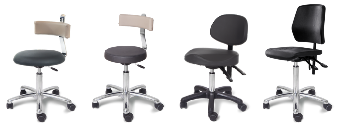
Bobbel Lux/ryg Round Classic/ryg Puk Lux Work Classic