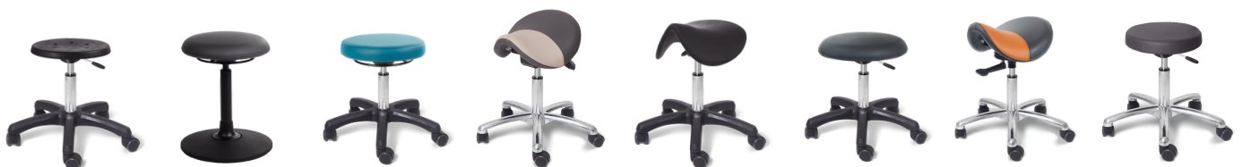
Round Classic Bobbel Vip Round Lux Sattel Lux Sattel Classic Bobbel Lux Saddle Lux Round Lux