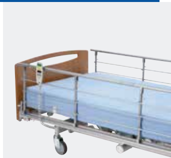
Invacare Scala Basic 2 Nedfældbar metalsengehest (15 cm).*