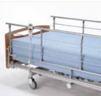
Invacare Scala Decubi 2 Nedfældbar metalsengehest til ekstra høje madrasser (29 cm).*