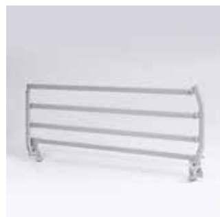
Invacare Verso II sengehest Moderne nedfældbar senge- hest. Passer til madrasser 10-16 cm.

* Alle Invacares sengeheste møder alle krav i sikkerhedsstandarden IEC 60601-2-52.