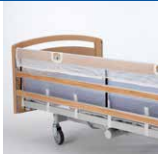
Betræk i net Betræk i net til Line og Britt V sengehest. Betrækket bliver på plads når sengehest er nedfældet. Leveres i standard og forlænget udgave (+100 mm og +200 mm).