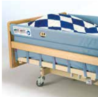
Sikkerhedsbetræk Anvendes sammen med integrerede træsengeheste godkendt efter EN1970 (gl standard) hvor der er et øget sikkerhedskrav.