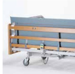
Forhøjet polstret betræk Polstret betræk til Line og Britt V med forhøjer.