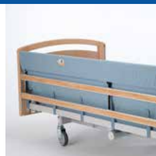
Polstret Polstret betræk til Line og Britt V sengehest. Betrækket bliver på plads når sengehesten er nedfældet. Leveres i polstret, ekstra polstret og forlænget (+100 mm og +200 mm).