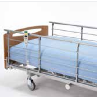
Invacare Scala Medium 2 Nedfældbar metalsengehest til høje madrasser (20 cm).*