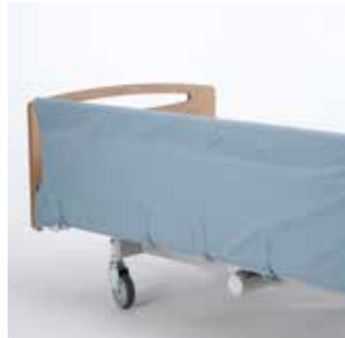
Betræk til metalsengehest Polstret betræk til metalsengehest. Betrækket bliver på plads når sengehest er nedfældet. Leveres i standard og ekstra polstret.