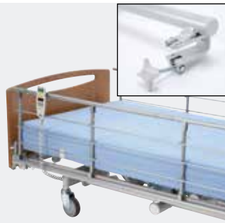
Invacare Scala Basic Plus 2 Nedfældbar metalsengehest med plastik indsats (15 cm).*