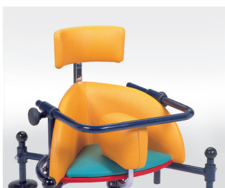
860: Hovedstøtte højdejusterbar