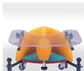
824: transparent bord