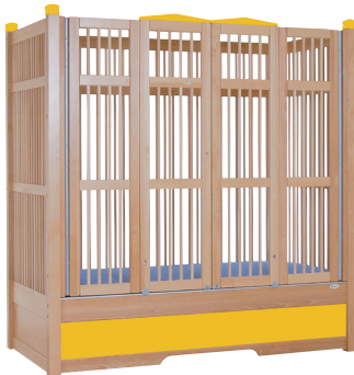
HANNAH 170 natur