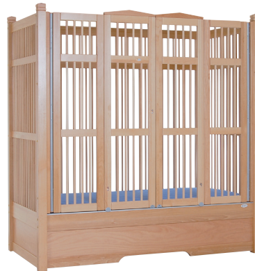
HANNAH 170 natur