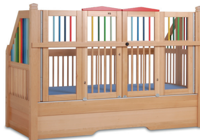
HANNAH 170 DACH