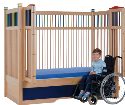
HANNAH 135 farve