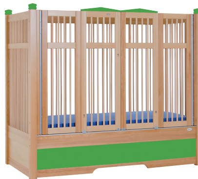
HANNAH 135 farve