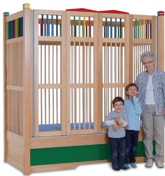
høj seng HANNAH 170 farve