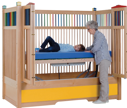
HANNAH 135 farve