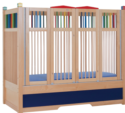
HANNAH 135 farve