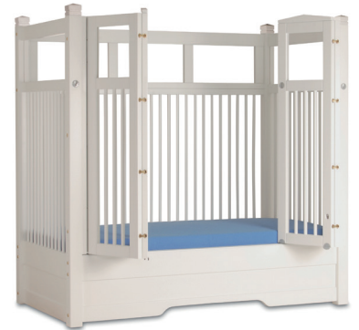
HANNAH 135 hvid