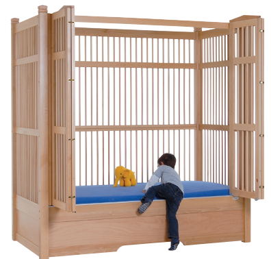
HANNAH 170 natur