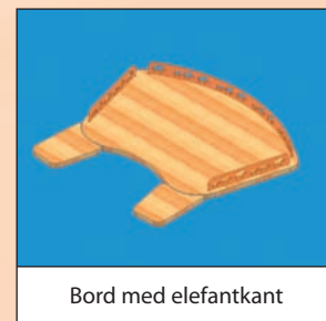
Bord med elefantkant