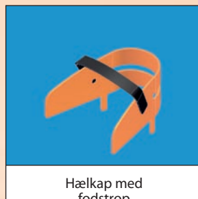
Hælkap med fodstrop