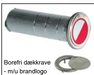
Borefri dækrave - m/u brandlogo