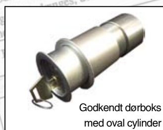
Godkendt dørboks med oval cylinder