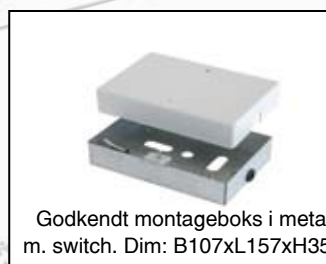
Godkendt montageboks i metal m. switch. Dim: B107xL157xH35