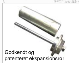
Godkendt og patenteret ekspansionsrør