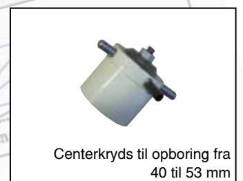
Centerkryds til opboring fra 40 til 53 mm