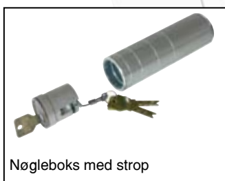
Nøgleboks med strop