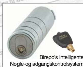
Birepo's Intelligente Nøgle- og adgangskontrolsystem