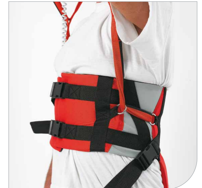
Selvstrammende ophængsløkker forhindrer sejlet i at glide.