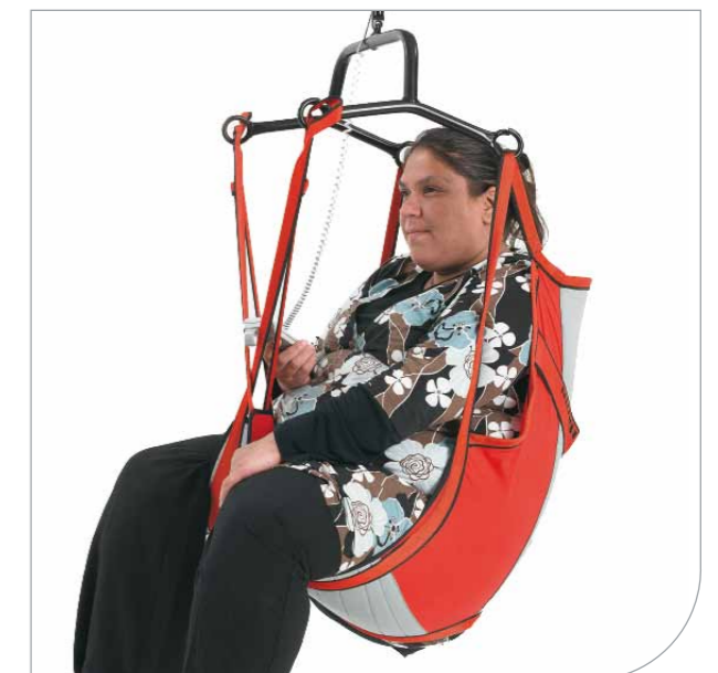
Ved hjælp af sejlets glideløkker får man en bekvem siddestilling i sejlet.