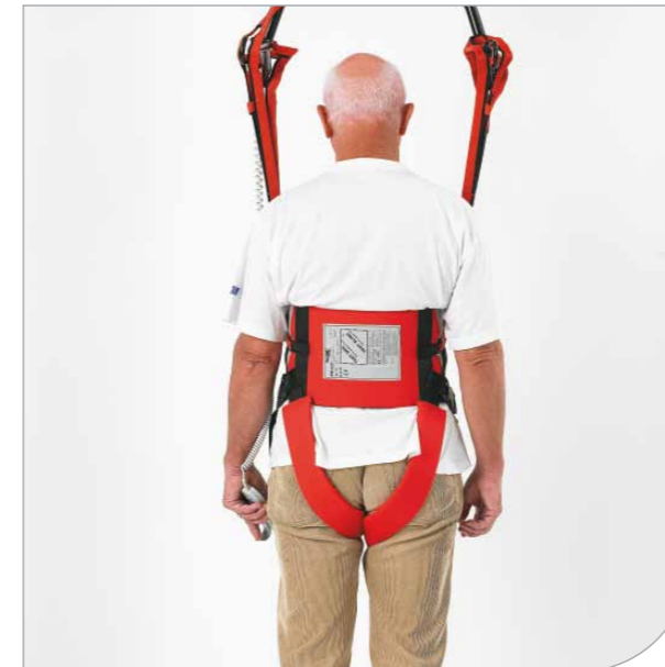
De polstrede benstropper forhindrer at bæltet rykker sig.

Det høje bælte har ekstra polstring, så tryk og belastning bliver jævnt fordelt. Det er udstyret med dobbelte bæltespænder for at opnå vekselstramning, så der opnås øget tryghed, støtte og stabilitet. De polstrede lyskestropper forhindrer, at bæltet glider op. Selvstrammende ophængsløkker forhindrer, at brugeren glider eller falder på gulvet, hvis benene skulle svigte. Belastningen på benene justeres ved at hæve eller sænke løfteren/loftliften.