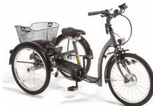
3-18 sykkel med Ansmann 20"