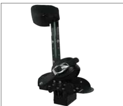
Fotplate med leggholder