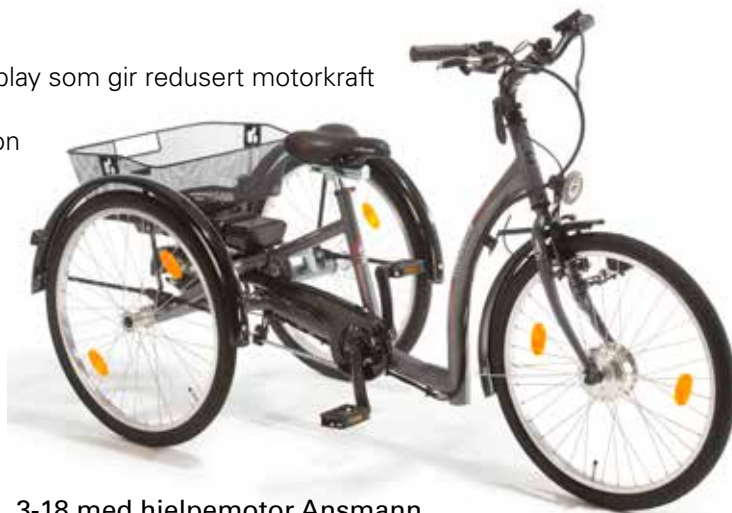
3-18 med hjelpemotor Ansmann

16" Sykkel med Ansmann har startshjelp opptil ca 3 km/t. Max hastighet fra fabrikk 11 km/t. 20" Sykkel med Ansmann har startshjelp opptil ca 4 km/t. Max hastighet fra fabrikk 14 km/t. 24" Sykkel med Ansmann har startshjelp opptil ca 5 km/t. Max hastighet fra fabrikk 20 km/t. 26" Sykkel med Ansmann har startshjelp opptil ca 5 km/t. Max hastighet fra fabrikk 22 km/t. 26" XL Sykkel med Ansmann har startshjelp opptil ca 5 km/t. Max hastighet fra fabrikk 22 km/t.