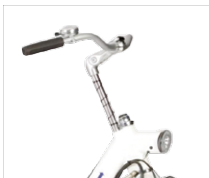
Frikoblings mulighet for styre foran. Her kan du bestemme om bruker skal styre sammen med ledsager, eller om ledsager skal styre alene.