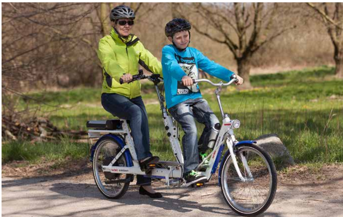
Lotse kan tilpasses barn fra rundt 3 år og opp til voksen.

Motor i bakhjul gir solid framdrift i motbakke