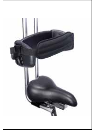
Kroppstøtte, bredderegulerbar (C)