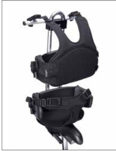
Overkroppsfiksering komplett (2 bredderegulerbare kroppstøtter, skrittsele og vest) (B)