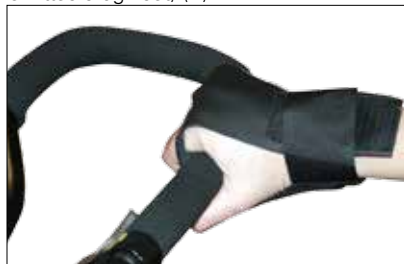
Håndfiksering, str. 12"-20" og 24"-26" (E)