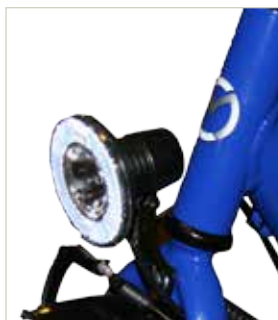
Lyssett alle modeller