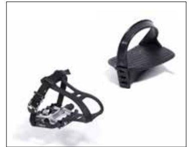
Pedal m/tåbøyle/lodd (J)- Fotplate balanse (K)