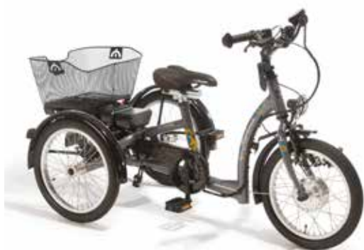
3-18 sykkel med Ansmann 16"