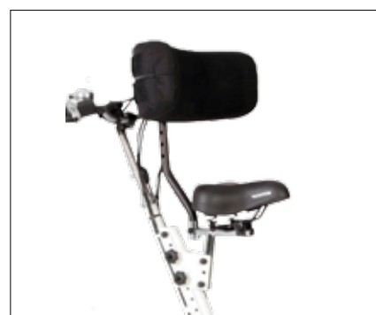
Seteadapter foran gir mulighet for å bruke tandemsykkelen for brukere fra 3 år