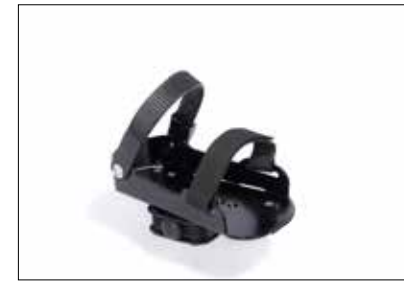
Fotplater m/lodd og rem. Leveres i 3 str. (I)