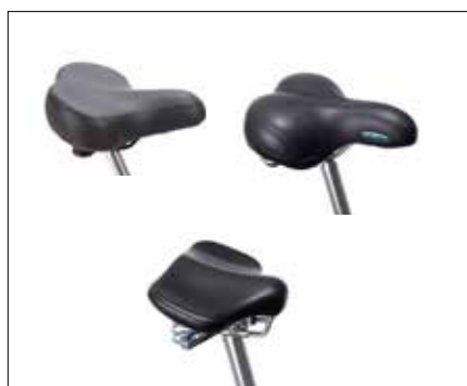
Det finnes en mengde tilbehør og sete-enheter se side 14 eller info under 3-18 syklene. Bilde viser sete Mofa / sete ekstra bredt / sete gele