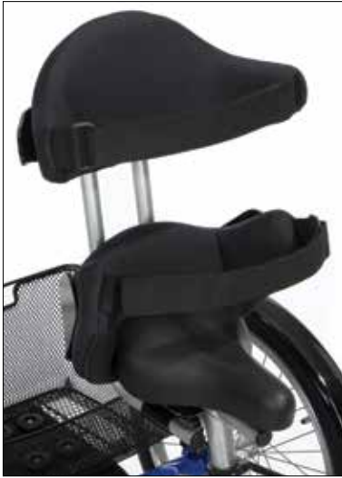
Hoftestøtte (A) og ryggstøtte med bøyle (se målskjema side 15)