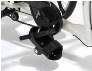
Fotplate med leggholder (H)