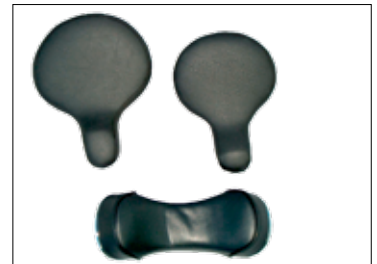
Abduksjonssete (F) og Banansete (G)