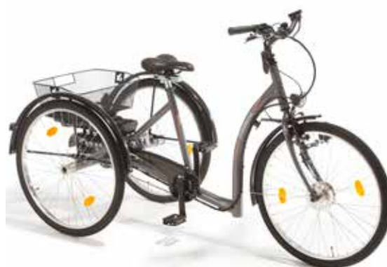
3-18 sykkel med Ansmann 26" og 26" XL

Ansmann hjelpemotor kit er velegnet til montering på 2-hjulssykler