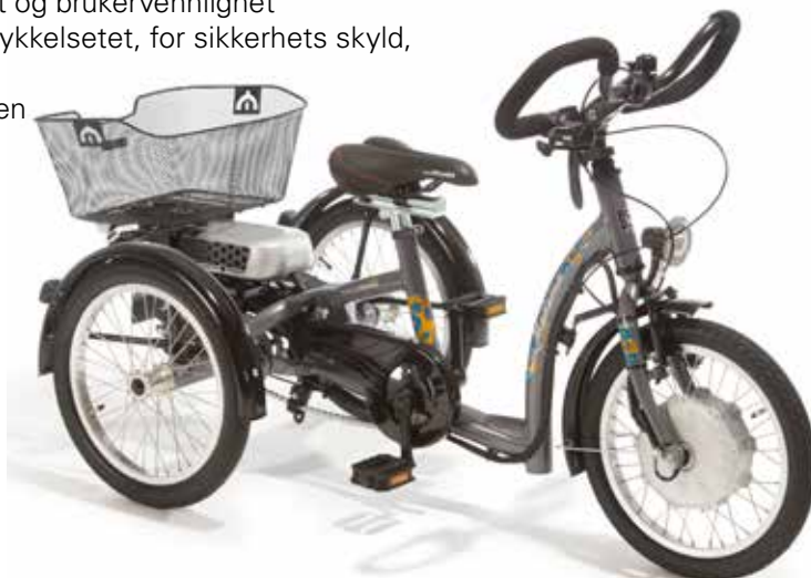
3-18 med hjelpemotor BionX

16" Sykkel med BionX: Start Up – FAG, maks hastighet 6 km/t (for best mulig kontroll og opplæring) 20" Sykkel med BionX: Start Up Plus – FAG, maks mulig hastighet 10 km/t 24" Sykkel med BionX: Mobility – FAG, maks mulig hastighet 17,5 km/t 26" Sykkel med BionX: Mobility – FAG, maks mulig hastighet 17,5 km/t 26" XL Sykkel med BionX: Mobility – FAG, maks mulig hastighet 17,5 km/t