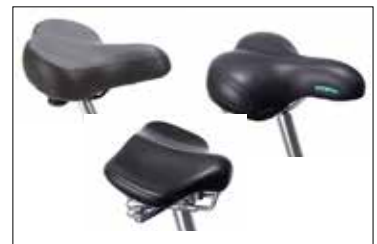
Sete Mofa (N) / ekstra bredt (O) / gele (P)

Ledsagerstyring med brems gjør det mulig for ledsager å skyve, styre og bremse sykkelen. En skikkelig problemløser som er spesielt velegnet til sykler med fastnav og til brukere med nedsatt funksjon. Denne løsningen øker brukers forståelse av å sykle og gjør det enklere å være ledsager. (Q)