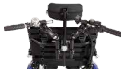
Ny styresats Draisin Plus