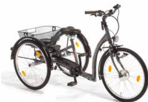
3-18 sykkel med Ansmann 24"