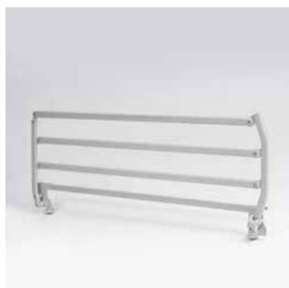
Invacare Verso II sengehest Moderne nedfældbar sengehest. Passer til madrasser 10 - 18 cm høje.

* Møder alle sikkerhedskrav i den nye standard for senge IEC 60601-2-52.