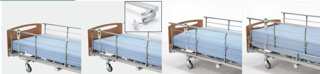
Invacare Scala Basic 2 Nedfældbar metalsengehest (15 cm).*