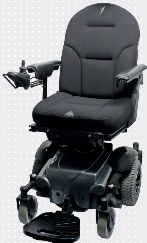
Blues 210 med centerdrev

Med VELA Blues 210 får brugeren en stabil stol, der er let at manøvrere. Centerdrevet giver minimal vendedi- ameter, så brugeren kan vende stolen, hvor der er et lille vendeareal. VELA Blues 210 har leddelt stel og fuld affjedring på både drivhjul og svinghjul. Dette giver særlig god kørekomfort på jævnt terræn - en fordel hvis brugeren let får smerter, fx ved dårlig ryg eller knogleskørhed.