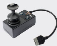
Ledsagerstyring - VR2