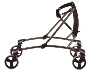
Mustang str. 4 med slimline hjul