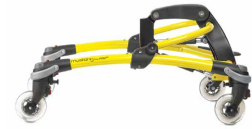
Mustang str. 1 med skaterhjul