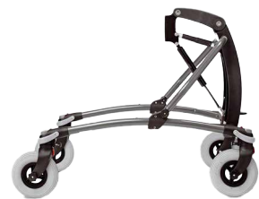
Mustang str. 4 med purhjul