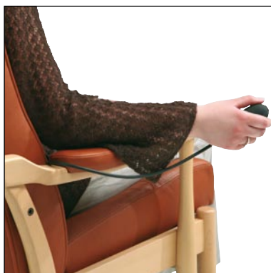
Oppustelig lændestøtte 0760