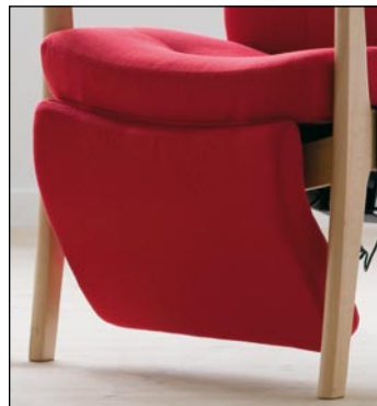
Også med kort fodhviler

Med Plus hvilestol er der frit valg mellem flere grundversioner, ryg-udformninger, sædedybder, sædehøjder, 1,2 eller 3 motorer samt en tilbehørs liste, der omfatter oppustelig lændestøtte, avisholder, armbakker, lukkede sider og skånepude.