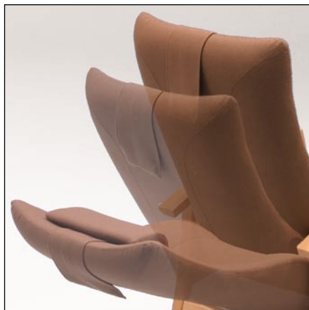
Regulering af ryg

Desuden fås den med hjul og batteri, så dine hjælpere kan køre dig rundt i huset – og spare tunge løft til og fra stolen.