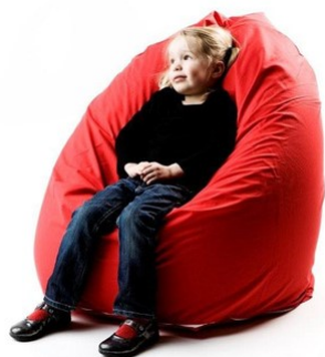
Sækkestol, barn 3200.

Brug sækkestolen i siddende stilling ved at stille den på den sekskantede bund. Form et hul til brugeren at sidde i og sørg for at brugeren placeres dybt ind og ned i materialet således at hele kroppen er støttet. Herved kan brugere placeres så opret som muligt og med fødderne placeret på gulvet. Personen kan således følge med i, hvad der foregår i rummet og ligeså føle vibrationer op igennem fødderne. Afhængig af siddestillingen kan der være behov for ekstra støtte til hovedet/nakken og evt. arme og underben.