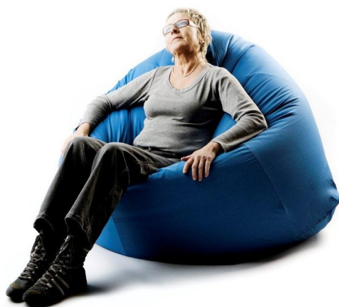
Sækkestol, voksen 5200.

Sækkestolen findes i tre størrelser, er fremstillet i et praktisk materiale, der er uigennemtrængeligt for væsker og leveres desuden med et aftageligt bomuldsbetræk.