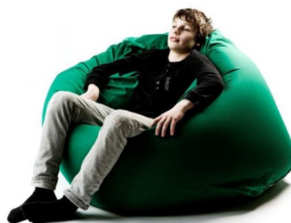
Sækkestol, junior 4200.

Brug sækkestolen i siddende stilling ved at stille den på den sekskantede bund. Form et hul til brugeren at sidde i og sørg for at brugeren placeres dybt ind og ned i materialet således at hele kroppen er støttet. Herved kan brugere placeres så opret som muligt og med fødderne placeret på gulvet. Personen kan således følge med i, hvad der foregår i rummet og ligeså føle vibrationer op igennem fødderne. Afhængig af siddestillingen kan der være behov for ekstra støtte til hovedet/nakken og evt. arme og underben.