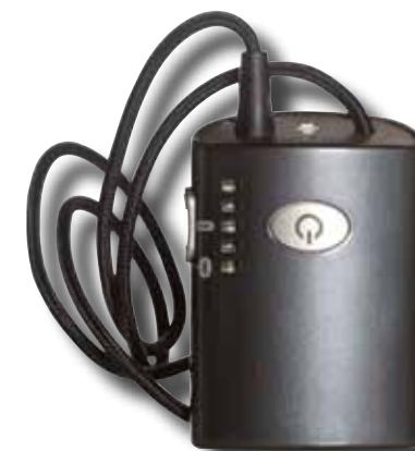
Trådløs modtager med halslynge