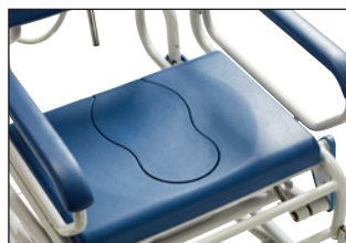
Sæde med låg