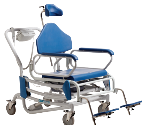
I laveste position med standard fodstøtter