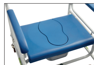
Sæde med låg