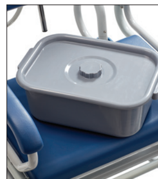
Bækkenspand med låg