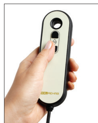
Håndbetjening giver plejeren fuld kontrol