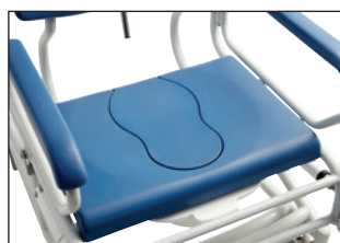
Sæde med låg