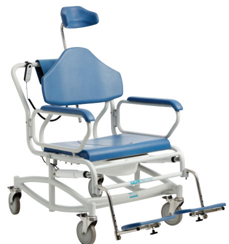
Med standard fodstøtter