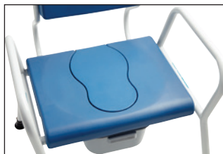
Sæde med låg

Ryglænet kan justeres til brugeren for at opnå en behagelig siddestilling. Ryglænet kan flyttes +/- 6 cm, og de buede rør sikrer en god siddekomfort.