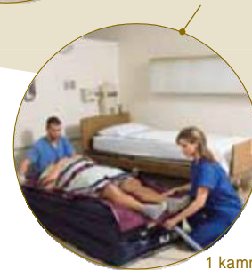
1 kammer oppustet