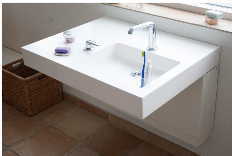
Billed af vask med el-højdejusterbart modul.

Forbehold for trykfejl el. prisændringer, jan. 2014.