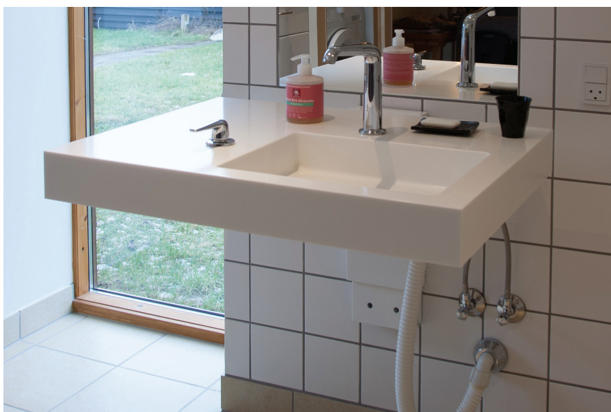
Billed af vask med manuel-højdejusterbart modul.

Forbehold for trykfejl el. prisændringer, jan. 2014.