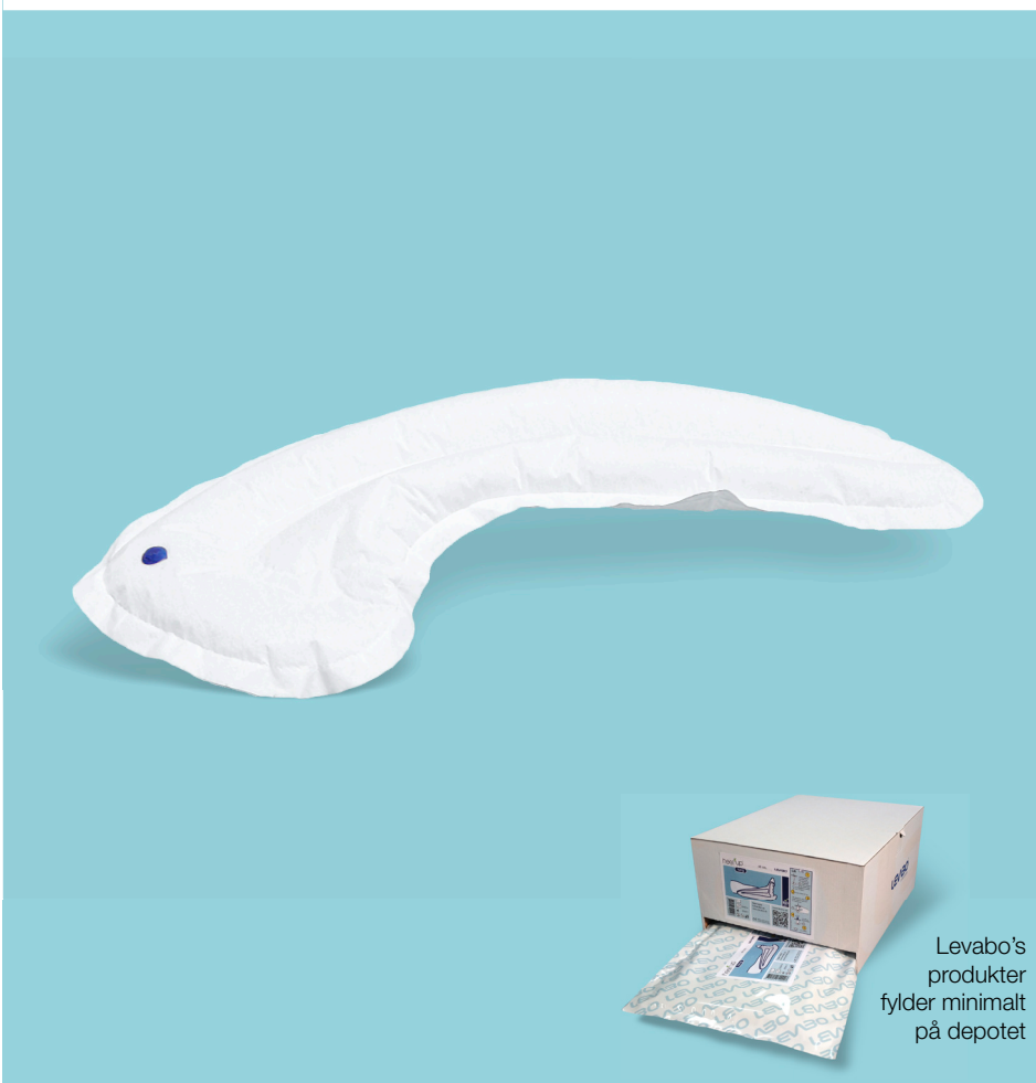
Levabo's produkter fylder minimalt på depotet