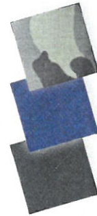
Jeans Schwarz Jeans Blau Camouflage