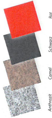
Anthrazit Camel Schwarz Rot

Fixierter oder abnehmbarer Kinnriemen, je nach Modell transparent