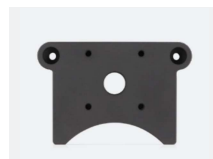
Quick release monteringsplade