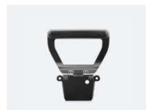
Monteringsplade med håndtag