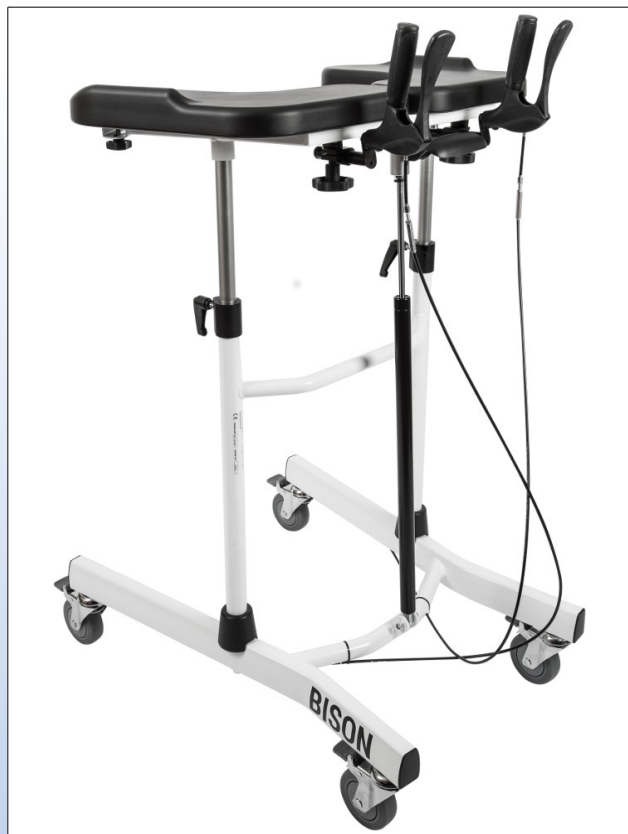
RBi1a. "Bison" gangbord

Et Bison gangbord er et bevægelseshjælpemiddel til at lære og træne aktiv gang. Det kan også bruges som støtte ved balanceproblemer. Rammen er lavet af pulverlakeret aluminium. Bison har mange indstillingsmuligheder: Armstøtterne kan meget let højdeindstilles ved hjælp af gasfjedrene. Håndtagene med bremsearme kan vinkelindstilles. Alle disse indstillinger kan foretages uden værktøj. De håndbetjente bremses virker på baghjulene, og alle 4 hjul er udstyret med låsbare bremses. Den smalle bredde gør det også muligt at passere smalle passager.