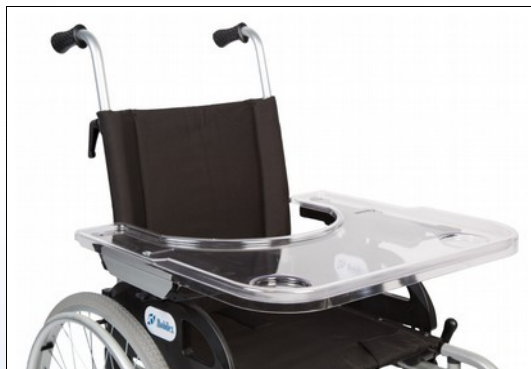
M1a. Universal terapibord monteret

Terapibordet er fremstillet i 6 mm brudsikkert, transparent materiale med kanter på 3 sider. Kan indstilles op til 9 cm i bredden, og for 28 – 58 mm polsterhøjde.