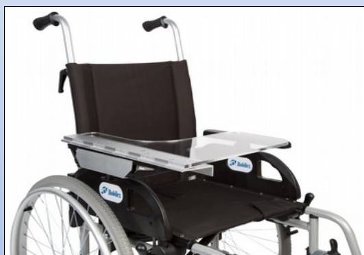
M1d. Halvsidigt terapibord

Fremstillet af 8 mm brudsikker transparent PETG. Terapibordet klemmes fast på armlænet med det unikke montagesystem som passer til armlæn i tykkelsen fra 28 til 58 mm. For tyndere armlæn kan der leveres en adapter