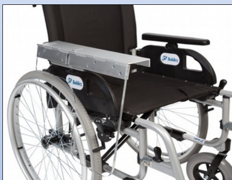
M1e. Halvsidigt terapibord nedklappet