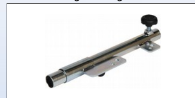
M2d. Armlænbeslag for 240001