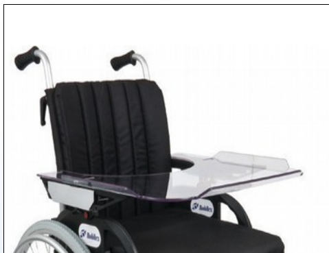
M1b. XL terapibord monteret