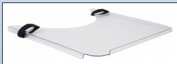
M3a. Terapibord med velcrobånd

Universal terapibord for montage på armlæn. Terapibordet er fremstillet i 4 mm brudsikkert, transparent materiale med kanter på 3 sider. Terapibordet er fastgjort på armlænene ved hjælp af to velcrobånd.