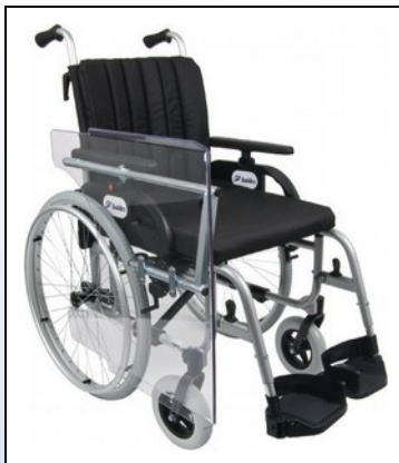
M2b. Therapibord nedklappet