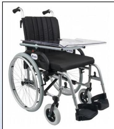
M2a. Terapiebord i brug

Målet på pladen er 57 cm x 38 cm (B x D) og den kan forskydes 8 cm