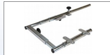
M2c. Montagebeslag for 240001