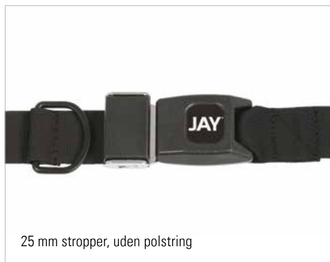
25 mm stropper, uden polstring

2-punkts hofteselev sikrer bækkenets position og placering på puden.