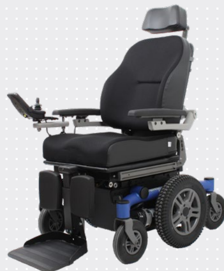
VELA Sango med centerdrev

Stolen er meget retningsstabil ved høj fart.