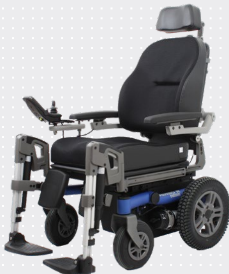
VELA Sango med baghjulstræk

Stolen kan komme rundt på smalle steder og der er plads til 90° vinkling af benene.