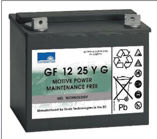
J1. EXIDE® Gel Batterier (Serie GF og GY)