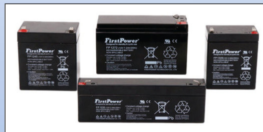
J3. FirstPower® AGM Batterier

Vi lagerfører batterier til de fleste typer personlifte fra 2 til 7.2 Ah.