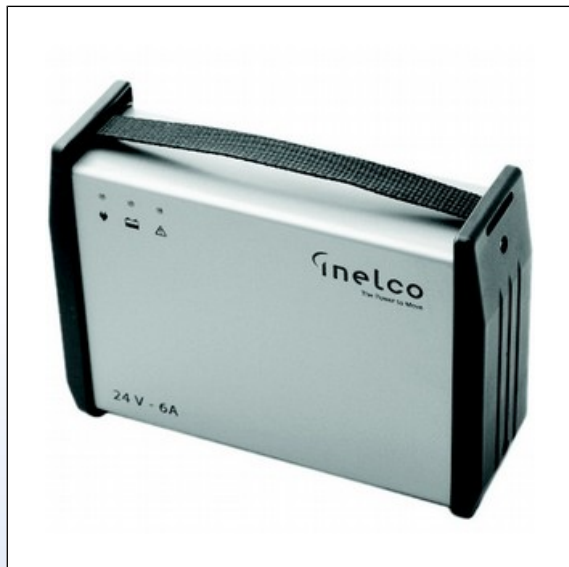
J3. INELCO IMC batterielader

Inelco IMC lader er optimeret til ladning af elektriske kørestole og køretøjer udstyret med to lukkede vedligeholdelsesfri bly-syre-batterier, seriekoblet til 24V.