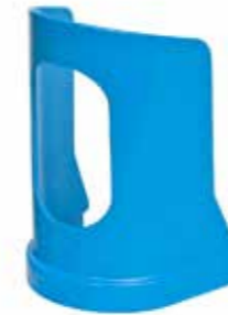
Stor HMI-nr. 119954 Varenr. 80202