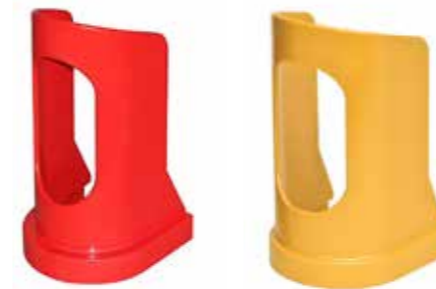
Lille HMI-nr. 119948 Varenr. 80202