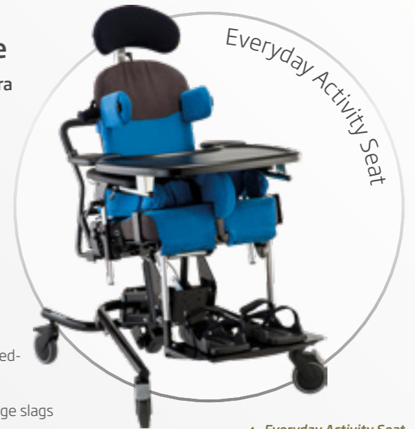
▲ Everyday Activity Seat str. 3 på hi-low understel med hydraulik, bord og stofbetræk.

Arbejdsstolen kan bestilles med stofbetræk eller vinylbetræk. Begge slags betræk fås i farverne sort, pink, blå eller lysegrøn.