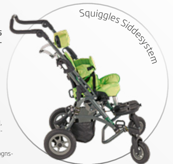
▲ Squiggles Siddesystem monteret på Kimba Neo klapvognsunderstel.

Squiggles siddesystemet kan også monteres på Kimba Neo klapvognsunderstel (side 124) og A-Run Chassis (side 96).