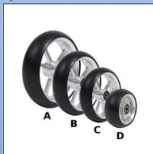
A2. Alu forhjul med sort bane