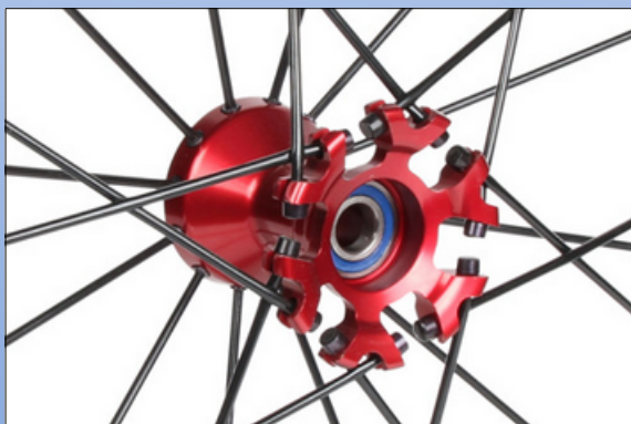
CX1i. Spinergy R10 nav 2,30", 3/8" lejer, rød eller sort til XSLX hjul