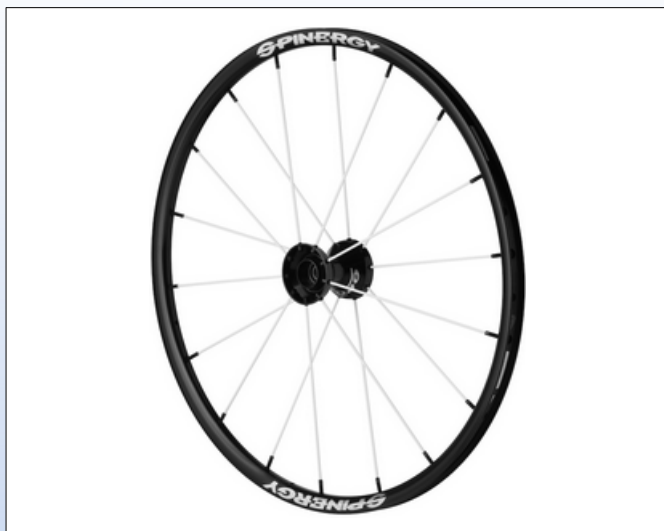
CX1a. Spox Everyday L

På forespørgsel leverer vi også Spinergy hjulene som komplette hjul, dvs. med drivring og dæk. Priser og muligheder findes i vores prislister.