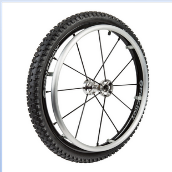
CX1t. Spinergy LX Offroad komplet hjul