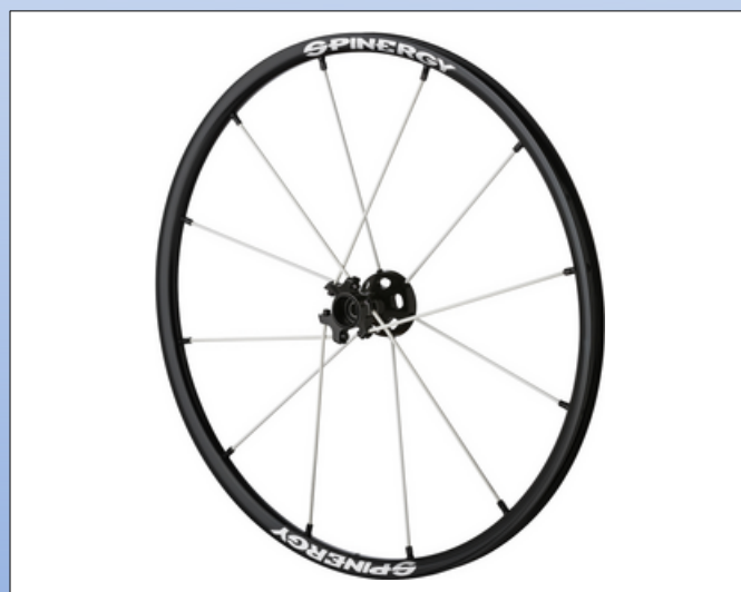
CX1q. Lite Extreme X-Laced XLX

Lite Extreme LX er designet med en unik, innovativ stil og er æstetisk tiltalende og er designet til at reducere vægten på din kørestol uden at gå på kompromis med dens holdbarhed og ydeevne.