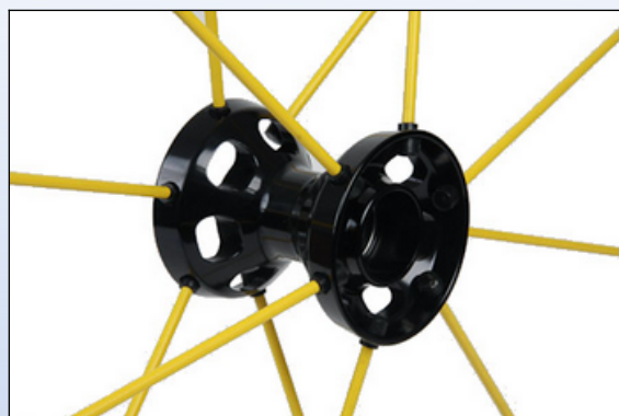
CX1j. Spinergy udfræst nav 1,80", ½" lejer, sort eller sølvfarvet til LX hjul