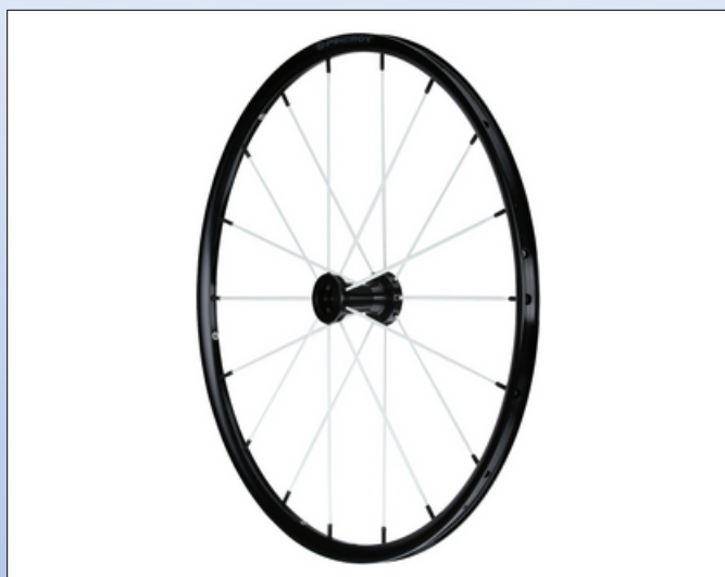
CX1e. Blade LXL

Den seneste designudvikling fra Spinerger, der bringer hjulets ydeevne til det næste niveau. Sport Lite Extreme SLX X-Laced hjul giver ekstra torsionsstyrke og hurtigere respons. Designet til atleter, der kræver endnu mere fra et hjul.