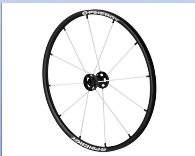
CX1b. Lite Extreme LX

Et billigt hjul i det gennemprøvede Spinergy design. Spox Sport SL er et fremragende universalhjul designet til holdbarhed uden at gå på kompromis med stil og ydeevne. Ideelt til kontaktsport som tennis, basketball osv.