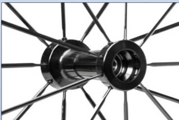
CX1i. Spinergy nav 1,80", ½" lejer, sort til CLX eller LXL Blade hjul