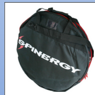
P13a. Spinergy hjultaske til hjul fra 22" til 28"