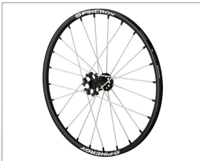
CX1g. Sport Lite Extreme X-Laced XSLX

Sport Lite Extreme SLX hjulet er ekstremt holdbart og ideelt til kontaktsportentusiaster. Hvis du har brug for et let, hurtigt accelererende og smidigt hjul, kan Sport Lite Extreme være dit svar. Dette hjul ser fantastisk ud, er stilfuldt og giver dig mulighed for at fokusere på spillet, ikke på udstyrsfejl.