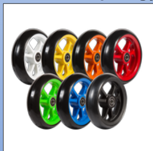
A27. Forhjul i eger farve