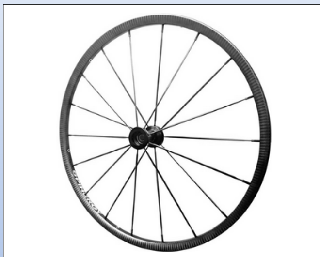
CX1h. Carbon Blade CLX

Blad eger: Blad egerne (Blade) tager denne model til et nyt niveau. Hver eger har en bladform for at skabe en slank og innovativ styling, der ligner avancerede aero-cykler.