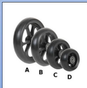
A26. Sort fiberhjul med sort bane