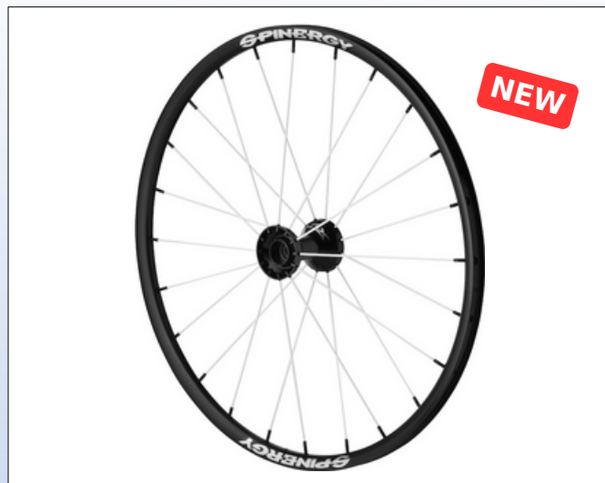
CX1p. Spox Sport SL

Spox Everyday L hjulet er letløbende, giver ekstrem holdbarhed og er ideelt til kontaktsport. Hvis du har brug for et let, hurtigt og adræt accelererende hjul kunne Spox være svaret. Dette hjul er stilfuldt og ser fantastisk ud.