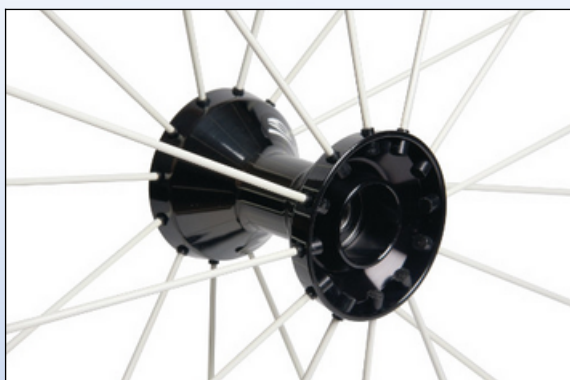
CX1k. Spinergy nav 1,80" eller 2,30", ½" lejer, sort eller sølvfarvet til L, LS, SLX hjul