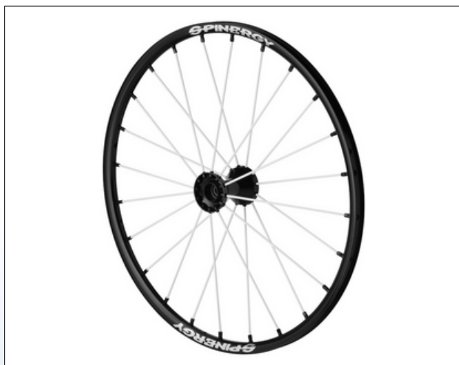
CX1c. Sport Lite Extreme SLX

Sport Lite Extreme SLX hjulet er ekstremt holdbart og ideelt til kontaktsportentusiaster. Hvis du har brug for et let, hurtigt accelererende og smidigt hjul, kan Sport Lite Extreme være dit svar. Dette hjul ser fantastisk ud, er stilfuldt og giver dig mulighed for at fokusere på spillet, ikke på udstyrsfejl.