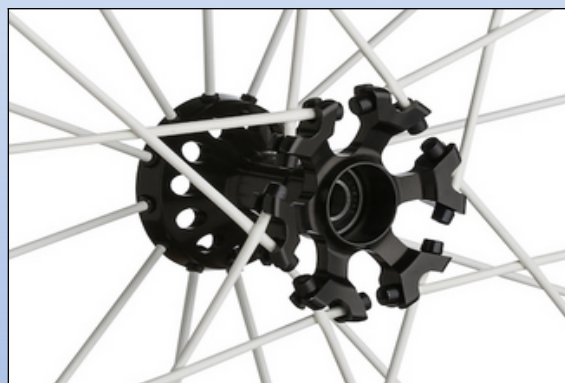
CX1r. Spinergy udfræst nav 2,30", ½" lejer, rød eller sort til XSLX hjul