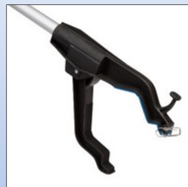
Q6e. Magnet i tang-enden

Gribetang med aluminium stang og ergonomisk håndtag. Gribetangen er udstyret med krog og magnet.