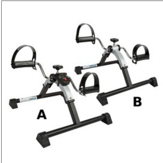
Q1. Pedaltræner med (A) eller uden (B) LCD

Simpel og robust arm- og bentræner med manuel indstillelig modstand. Kraftig metalramme med kunststofpedaler med justerbar rem. Tilgængelig med eller uden LCD display.