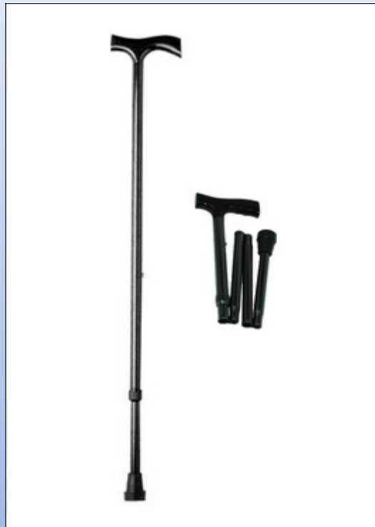
Q3b. Spadserstock af aluminium et stykke (venstre) eller foldbar (højre)

Højdejusterbar spadserstock af sort aluminium med sort håndtag.