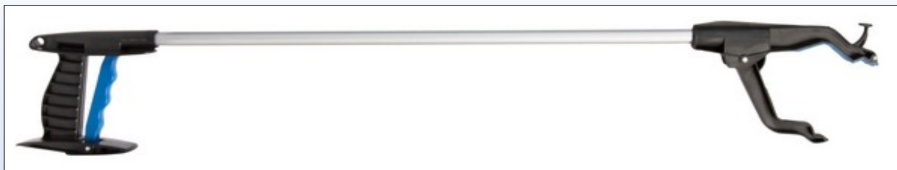
Q6. Gribetang i længde 87 cm, 74 cm (på billedet) eller 59 cm