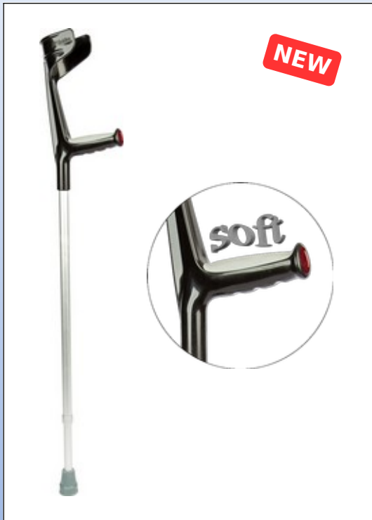
Q3a. Krykstock af aluminium

Højdejusterbar krykstock af aluminium med sort håndtag og blødt håndstøtte med reflektor.