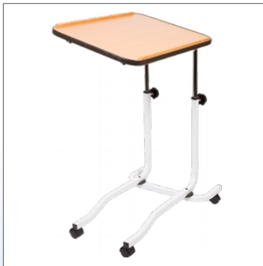
Q2. Sengebord på hjul

Sengebord med mange indstillingsmuligheder. Kan anvendes som både sengebord og læsepult. Højden på arbejdspladen kan indstilles fra 72 til 110 cm, og pladen kan vippe trinløst i begge retninger.