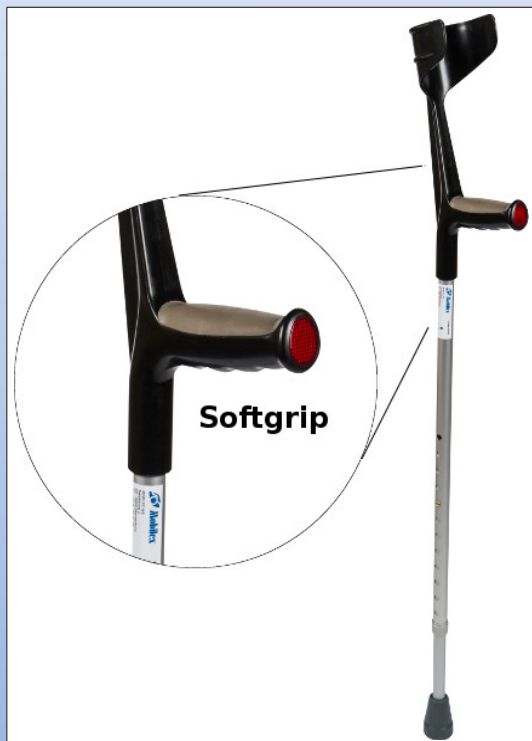
Q3a. Krykkestok af aluminium med blødt greb

Krykkestok af aluminium, sølv med sort håndtag og blødt greb