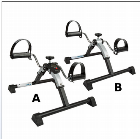
Q1. Pedaltræner med (A) eller uden (B) LCD

Simpel og robust arm- og bentræner med manuel indstillelig modstand. Kraftig metalramme med kunststofpedaler med justerbar rem. Tilgængelig med eller uden LCD display.