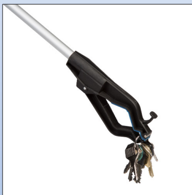
Q5c. Krog i tang-enden