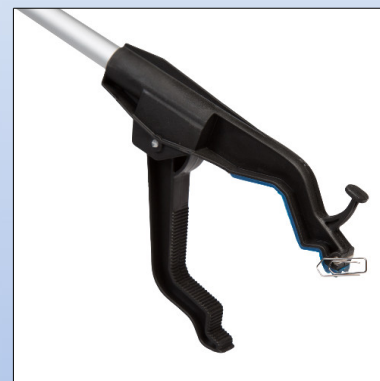
Q5e. Magnet i tang-enden

Gribetang med aluminium stang og ergonomisk håndtag. Gribetangen er udstyret med krog og magnet.