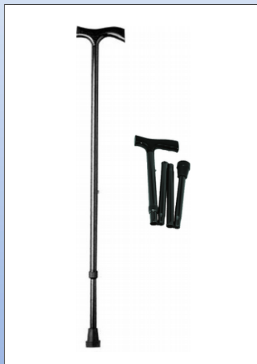
Q3b. Spadserstok af aluminium et stykke (venstre) eller foldbar (højre)