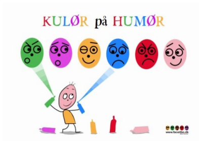
Brætspil kulør på humør