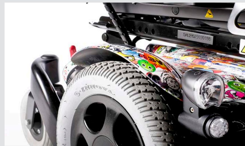
Individuel kørestolsramme design-folie

Men der er mere. Vores BUILT-4-ME afdeling har skabt tusindvis af skræddersyede kørestole. Når du vil bryde formen, hjælper vi dig med at skabe en helt unik kørestol.