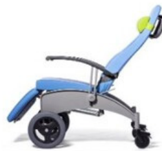
RELAX-POSITION / ZERO-GRAVITY