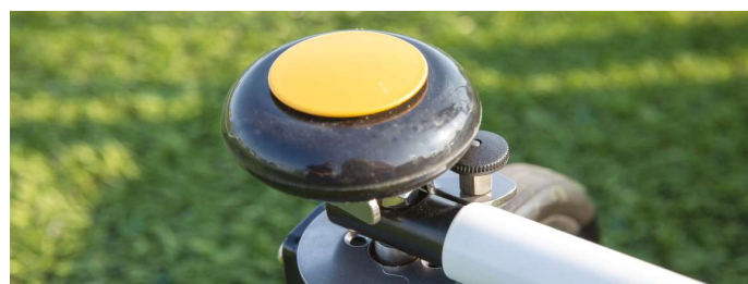
RETNINGSLÅS AF HJUL

EKSKLUSIVT UDVIKLET AF MADE FOR MOVEMENT, XPLORE ER BASERET PÅ MERE END 25 ÅRS ERFARING MED GANGHJÆLPEMIDLER.