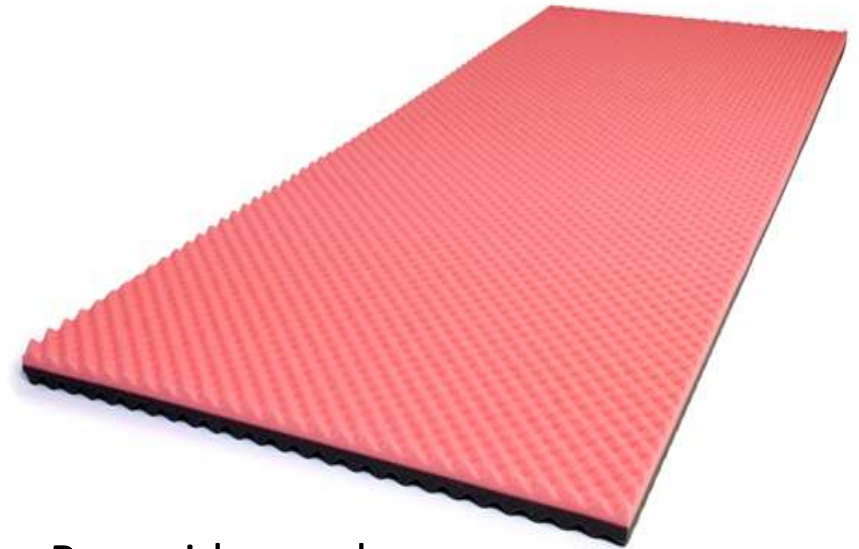
Rosa side vendes op