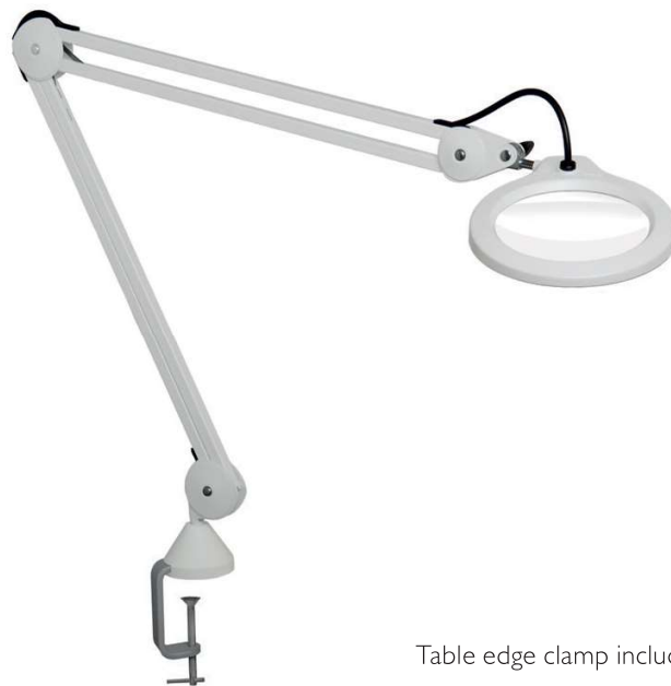
Table edge clamp included