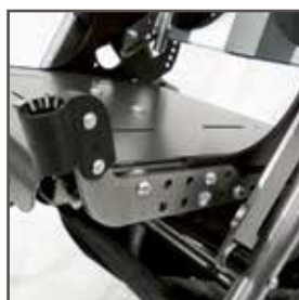
3232-2201 Fæste for håndbøjle og bord