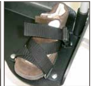
3201-6300 Fodremme par