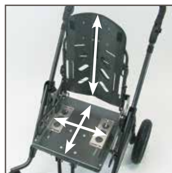
Ryglæns højde, sædedybde og -bredde