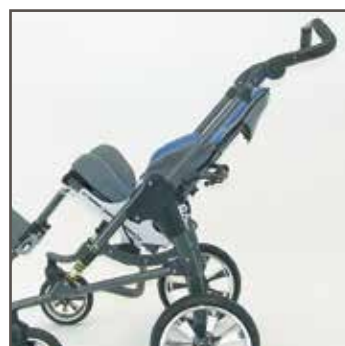
Kan vippes i begge retninger