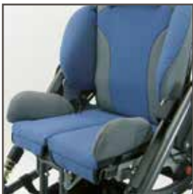
3231-2900E Lårstøtter str 1. bredde og dybde-regulerbar