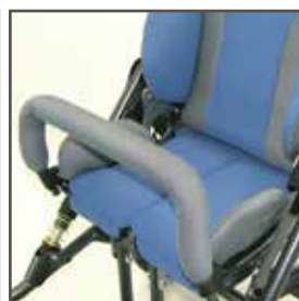
32-31-8100 Håndbøjle str 1 polstret u/fæste 3232-2201 Fæste for håndbøjle