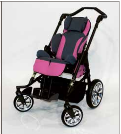
3231-5100E-340 Bingo Evolution farve pink/ mørk grå