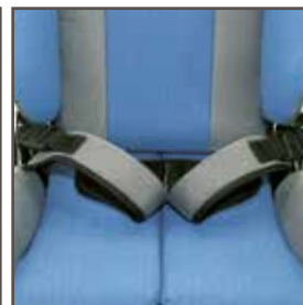
3231-5300 Abduktionssele str 1