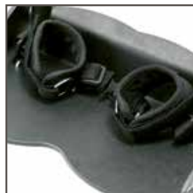
3201-6400 Ankelfiksring par