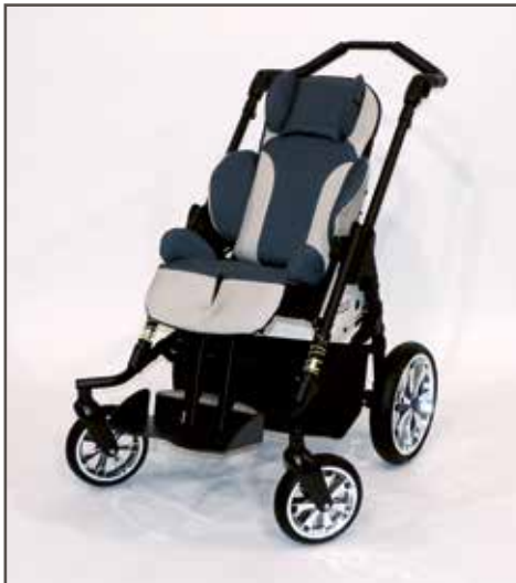
3231-5100E-338 Bingo Evolution farve sand/ mørk grå