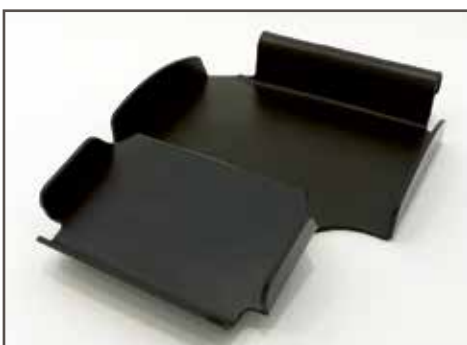
Bakke til ekstra udstyr