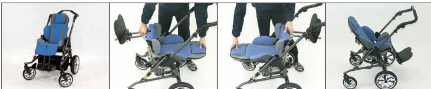
Sædeenhed monteret i køreretningen