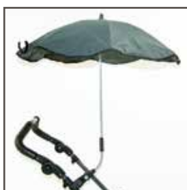
7000-0012 Solskjærm inkl. fæste