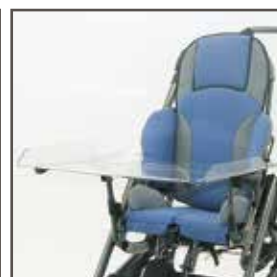
3231-8200 Bord str 1 plæxi u/fæste 3231-8202 Bord str 1 plæxi højeregulerbart u/fæste 3232-2201 Fæste for bord