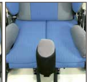
3201-7800 Abduktionsklods str 1, nedfældelig, aftagelig 3201-7900 Abduktionsklods str 2, nedfældelig, aftagelig