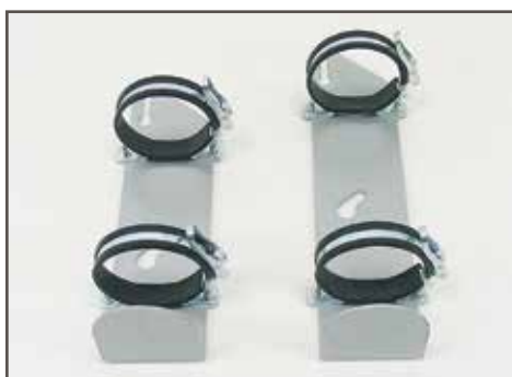
3231-4201Oxygenflaskeholder 100mm diameter, maks. 40cm højde 3231-4201Oxygenflaskeholder 100mm diameter, maks. 75cm højde