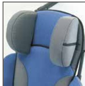
Hovedstøtte str 1