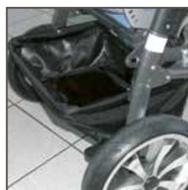
3231-9402 Kurv str 1 (maks. 8 kg)