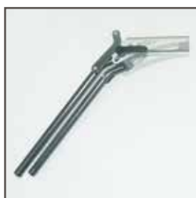
Fodstøtkehænger: Justerbar vinkel 90-160°, standard