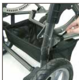
Blød tilbehørstaske (maks. 3 kg) (standard)