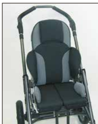
Sort ternet/grå standard

Alle BINGO Evolution -chassiser og sædeenheden fås i blank grå og i mat sort.