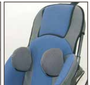
3231-7700 Sidestøtter str 1 (8x10x2cm) par 3233-7700 Sidestøtter str 2 (10x12x2cm) par