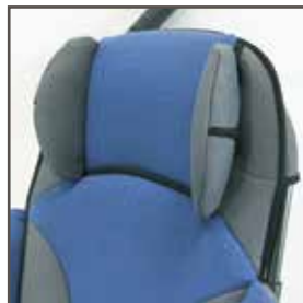
3231-7600 Hovedstøtte lav str 1