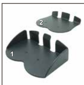
(1) 3231-249-31E Fodplade 31cm bredde 3231-249-33E Fodplade 33cm bredde (2) 3231-2551E Fodplade str.1 med sideplader