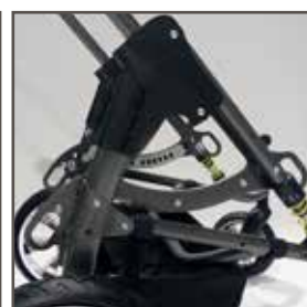
Transportsikring (iht. ISO 7176-19)