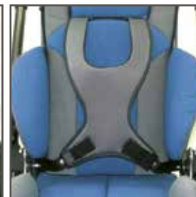
3201-5600 Brystvest str 1 3201-5700 Brystvest str 2