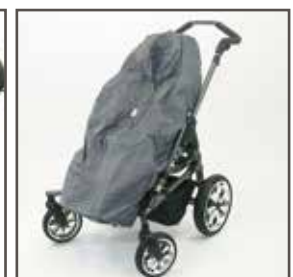
3201-9200 Regncap str 1