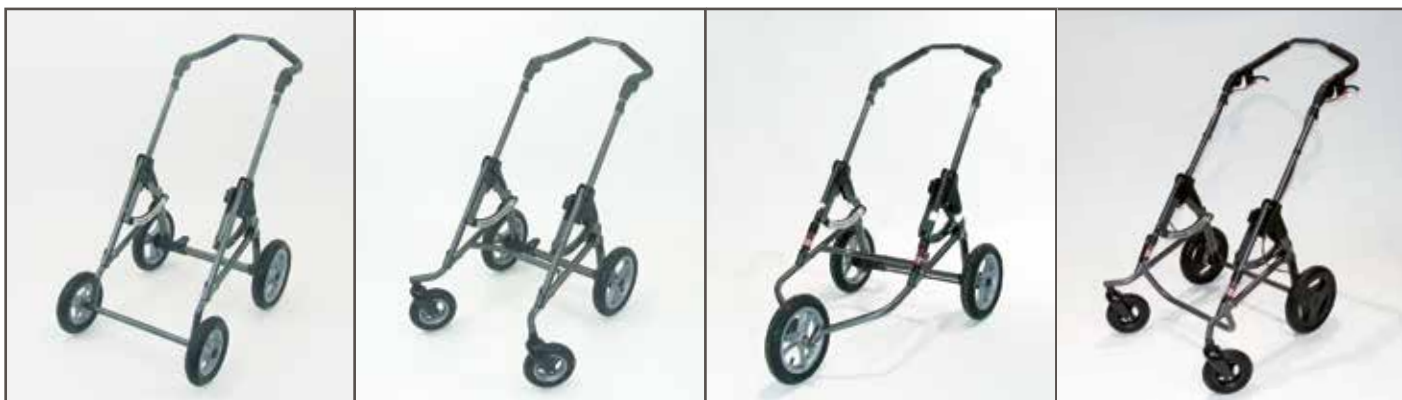
Chassis med faste forhjul