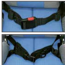
3201-6100 Hoftebælte 3231-6702 4-Punkts S (for SB 22-30) 3231-6701 4-Punkts S (for SB 18-24)