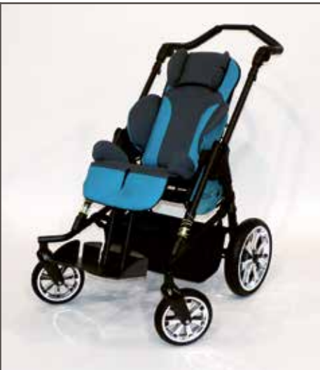
3231-5100E-339 Bingo Evolution farve turkis/ mørk grå