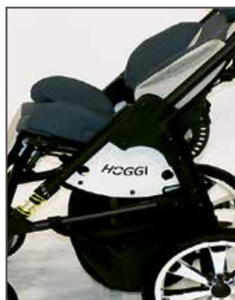
NYHED: Sideplader, der matcher alle farvevarianter