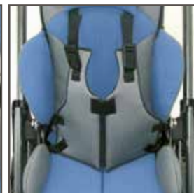
3201-5800 Fikseringsvest str 0 3201-5400 Fikseringsvest str 1 3201-5500 Fikseringsvest str 2