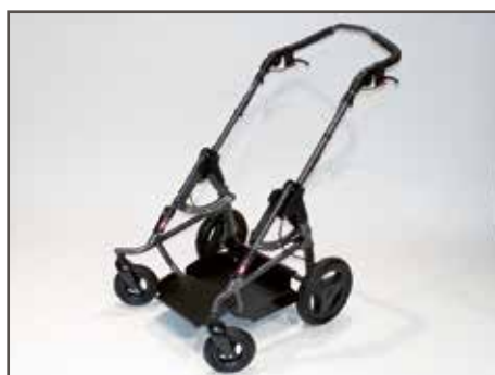
3238-005-032 Bingo Evolution str.1 special f. respirator m/ låsbare svb. forhjul, polster sort/ grå, inkl. fotplade 29 cm, hofte støtter aftagelige, massive hjul, kurv og indstibar affjedring