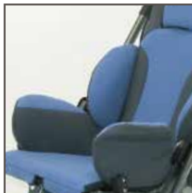
Hoftestøtter, aftagelige: Mulighed for justering af bredde og dybde (standard)