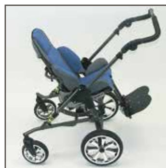
Sædeenhed modsat køre- retning