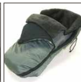
7000-0018 Fåreskindssats str 1 varmegpose 7000-0019 Fåreskindssats str 2 varmegpose 3201-8300 Varmepose str 1 vinter 3201-84300 Varmepose str 2 vinter