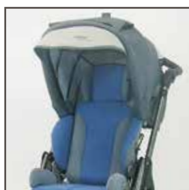
3201-9300 Kaleche m/regnovertræk