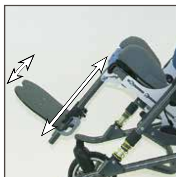
Underbenslængde og fod- pladevinkel