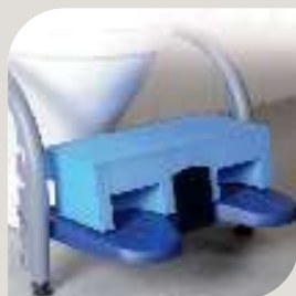
MINI FODSTØTTE VARENR. B-10 132 H. 100 mm B. 370 mm D. 150 mm