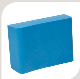
RYG PUDE VARENR. B-10 035 HMI-NR.: 37060 H. 250 mm B. 360 mm D. 100 mm