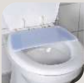
ISC PLADE VARENR. B-10 542 B. 170 mm L. 340 mm