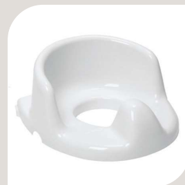
HUL FORMINDSKER – lille med forhøjede kanter. VARENR. B-10 049 HMI-NR.: 37050 B. 146 mm L. 193 mm