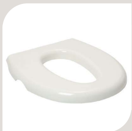
HUL FORMINDSKER – lille. VARENR. B-10 047 HMI-NR.: 37058 B. 143 mm L. 255 mm