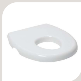
HUL FORMINDSKER – extra lille. VARENR. B-10 050 B. 140 mm L. 163 mm