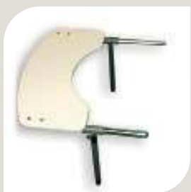
BORDPLADE VARENR. B-10 127 600 x 315 mm