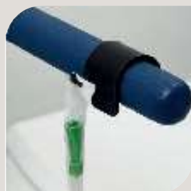
KATETER HOLDER VARENR. B-10 538 Kateter holder inklusiv tube VARENR. 10 540