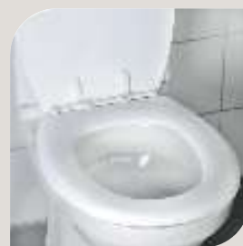
TOILET SÆDE – standard VARENR. B-10 041 Indre dimensioner B. 225 mm L. 273 mm.