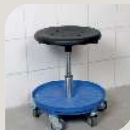
STOL TIL HJÆLPER VARENR. B-10 541