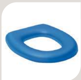
BLØDT SÆDE BLÅ: VARENR. B-10 399 HVID: VARENR. B-10 398 Indre dimensioner: B. 210 mm L. 245 mm