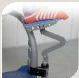
ISC BACKING VARENR. B-10 515 B. 90 mm L. 160 mm