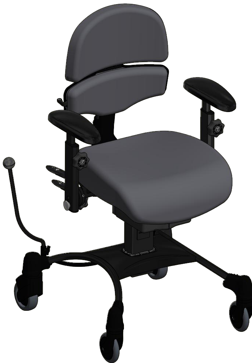
VELA Tango 500E ALB small