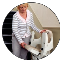
Sæde slæes op når liften er parkeret