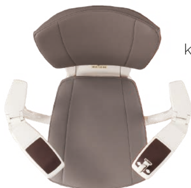
Lige eller kurvede armlæn

Flyt mellem alle etager i dit hjem med maksimal komfort og sikkerhed. Hvis du har en trappe med sving, kan vi også hjælpe dig.