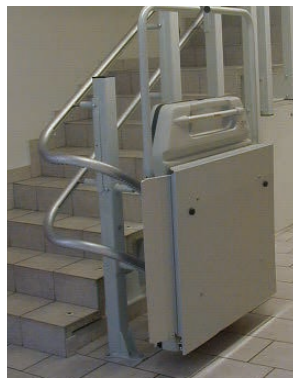
Platformslift m. sving