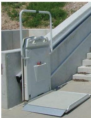
Platformslift lige trappe