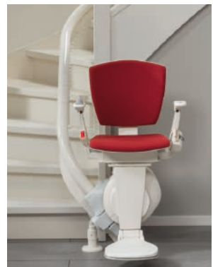
Stolelift til trappe m. sving