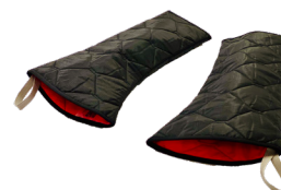
MC 003-9031 MC 003-9034 MC 003-9035