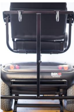
Karma 741 el-scooter vist bagfra med rollatorstativ (rollatorstativ er tilkøb)